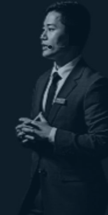
김용덕 변리사 지음