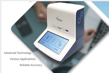
Advanced Technology Various Applications Reliable Accuracy