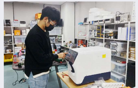
DERISA 장비 시연