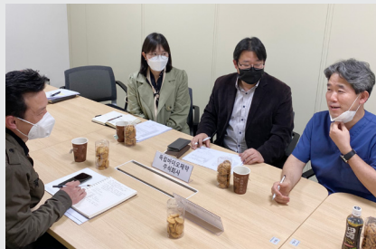
아주대병원 개방형실험실 임상의 자문