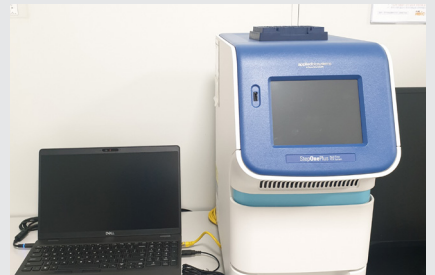
아주대병원 개방형실험실 연구장비